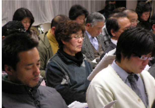
熱心に聞き入る参加者