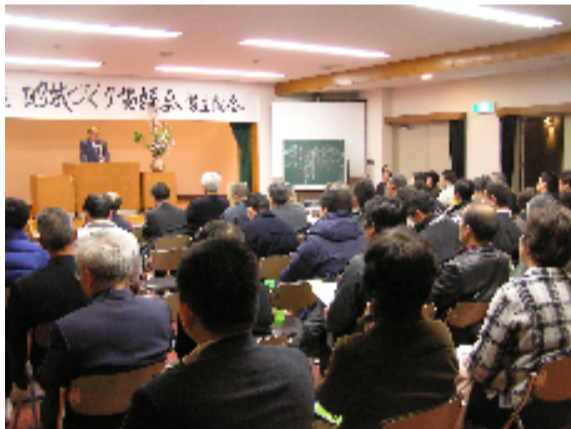
会場は満員になった